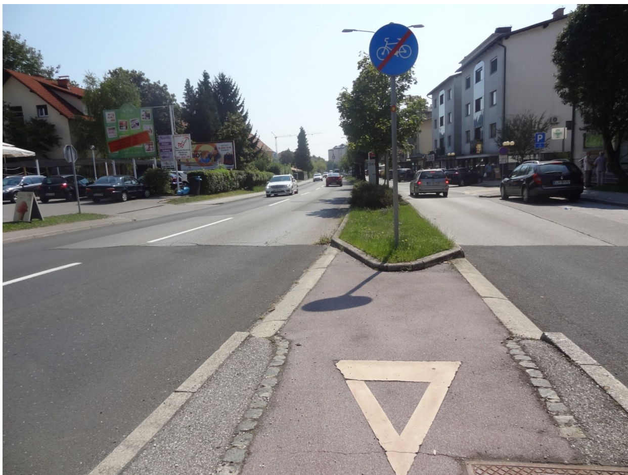
Nevarno vključevanje kolesarjev na cesto