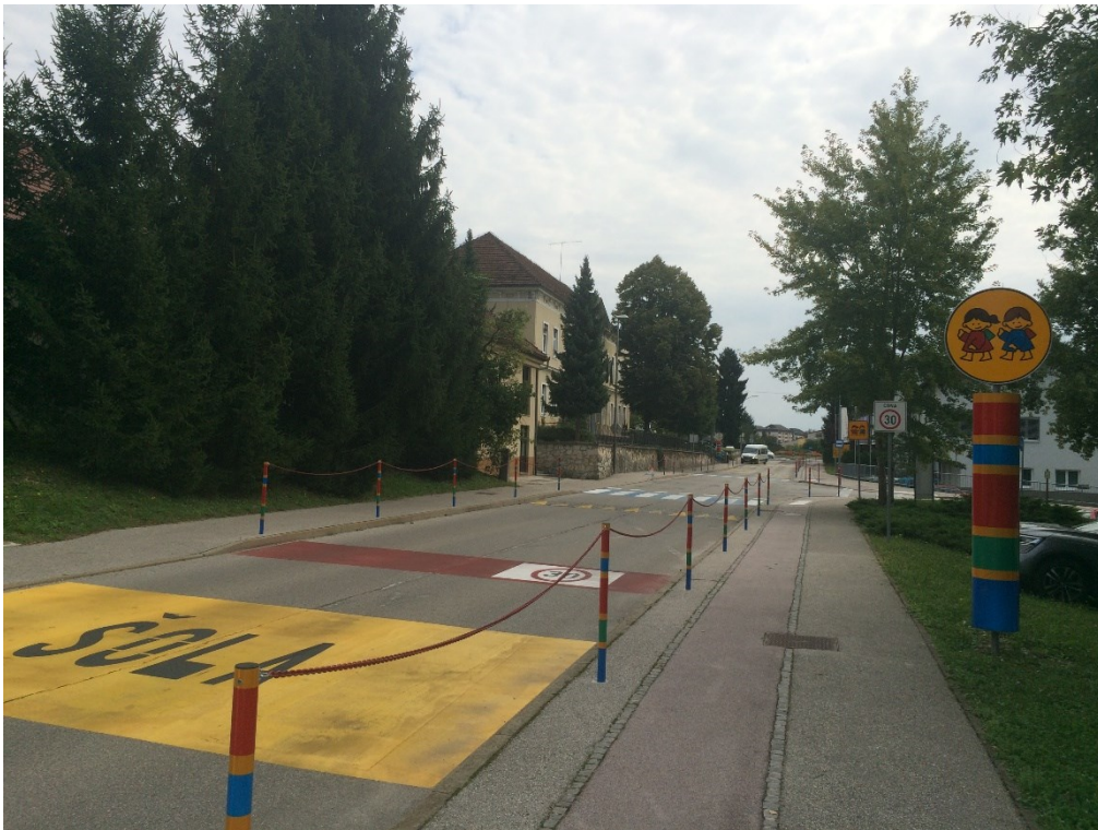
Cesta s talno označbo »ŠOLA«, opozorilno tablo in zaščitno verigo na pločniku