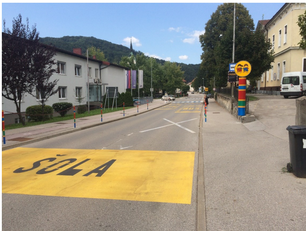
Dovoz na šolsko dvorišče in avtobusno postajališče na cestišču