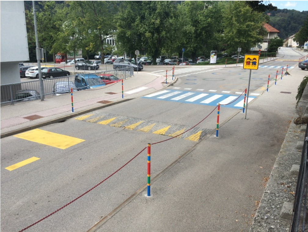
Prehod za pešce